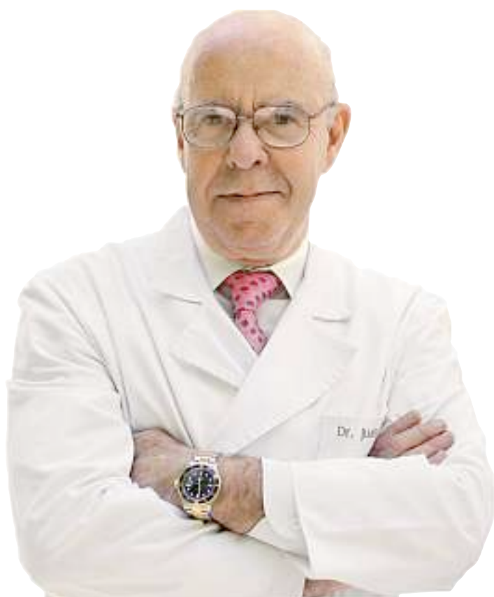
JUAN PEÑAS HOSPITAL SAN RAFAEL

QUIÉN: Dirige el servicio de Cirugía Plástica del Hospital San Rafael de Madrid.