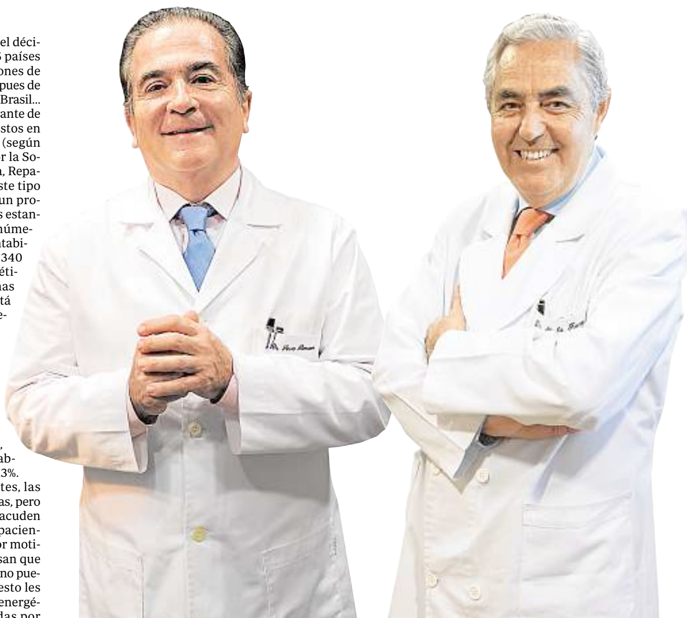
J.M. SERRA RENOM HOSPITAL QUIRÓN BARCELONA

La edad media ha disminuido en los últimos 15 años. La mujer espera menos para retocarse. Entre los 18 y los 40 años, es cuando más rinoplastia se realizan, y es en este rango de edad cuando la liposucción y la cirugía de mama supera con creces al resto. Las zonas que más se tratan son las cartucheras, la cara interna de los muslos y los flancos. Rondando los 40 años las mujeres